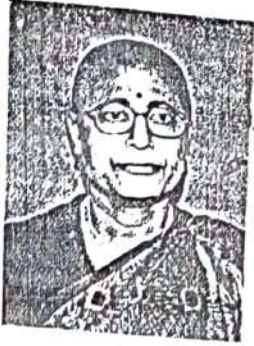
দাতা / গ্রহীতা